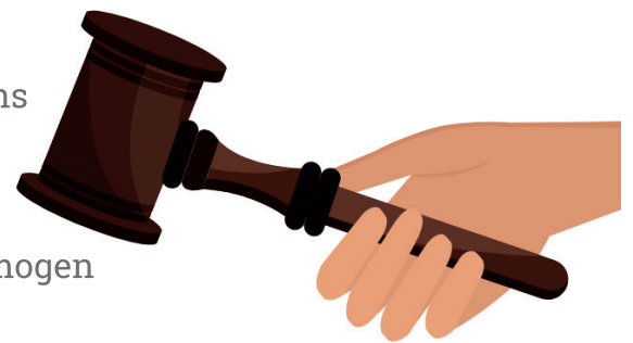
Bezoek aan de rechter

Ongeveer 4 tot 8 weken na aanvraag stuurt de rechtbank ons allebei een uitnodiging. We gaan samen op gesprek. Je begeleider mag ook mee. Tijdens ons bezoek stelt de rechter vragen. Daarna besluit hij of wij je bewindvoerder mogen worden. Hij stuurt ons daar ook nog een officiële brief over. En als die binnen is mogen we voor je aan de slag.