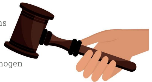
Bezoek aan de rechter

Ongeveer 4 tot 8 weken na aanvraag stuurt de rechtbank ons allebei een uitnodiging. We gaan samen op gesprek. Je begeleider mag ook mee. Tijdens ons bezoek stelt de rechter vragen. Daarna besluit hij of wij je bewindvoerder mogen worden. Hij stuurt ons daar ook nog een officiële brief over. En als die binnen is mogen we voor je aan de slag.